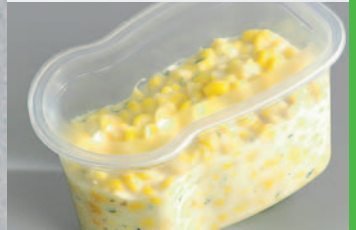
UV-Filter: Qualität bleibt länger erhalten.