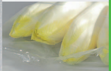
UV-Filter: frischeres Aussehen