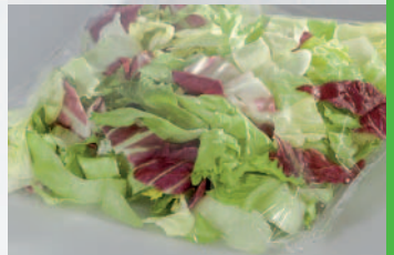
Antifog-Beschichtung: keine Kondenswassertropfen

Die Oberflächenspannung des sich auf der Folie abscheidenden Wassers wird reduziert. Es bilden sich keine einzelnen Kondenswassertropfen, sondern ein transparenter Film.